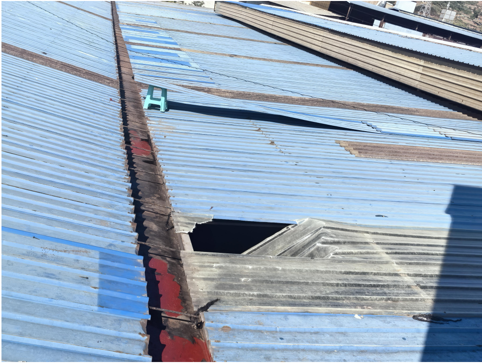
图 1 事发厂房彩钢棚概貌