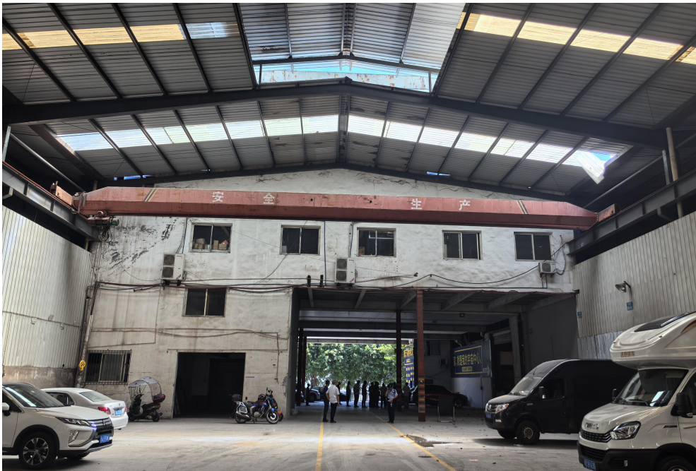
图 2 钢天沟和破损塑料亮瓦