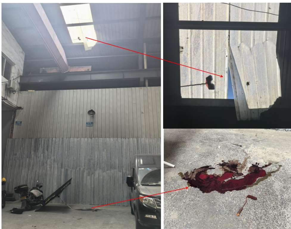
图 4 作业人员坠落位置